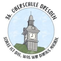
Bild- und Literaturquellen